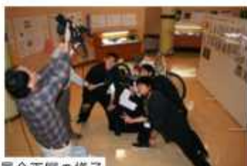
第1回高校生学芸員企画展の様子